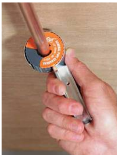
Использование рукоятки возможно даже в труднодоступных местах

Отрезные колесики изготовлены из высокопрочной стали и легко заменяются.