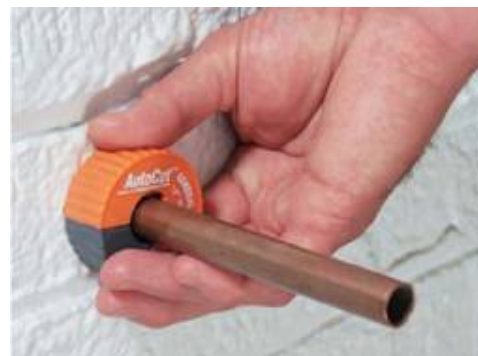
Отрезание возможно даже вплотную к стене